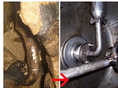
Reinigung Schokolade & Karamell